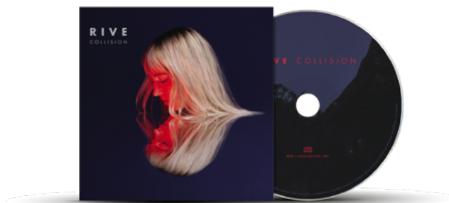
« Collision » est le deuxième album de RIVE