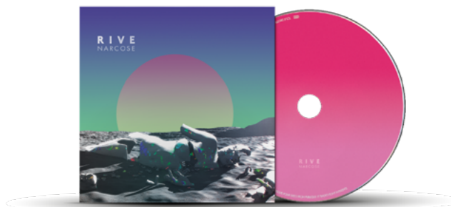
« Narcosse » (2019)