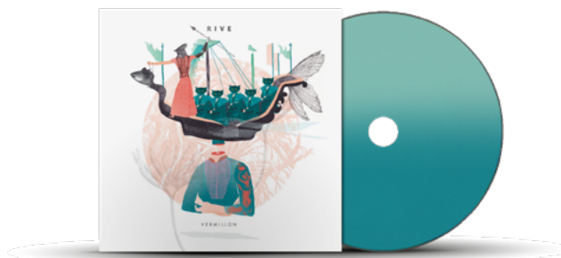
EP « Vermillon » (2017)